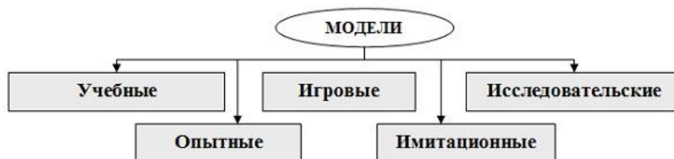
Рис. 1.3. Классификация моделей по области использования

Классификация по области использования модели представлена на рис. 1.3.