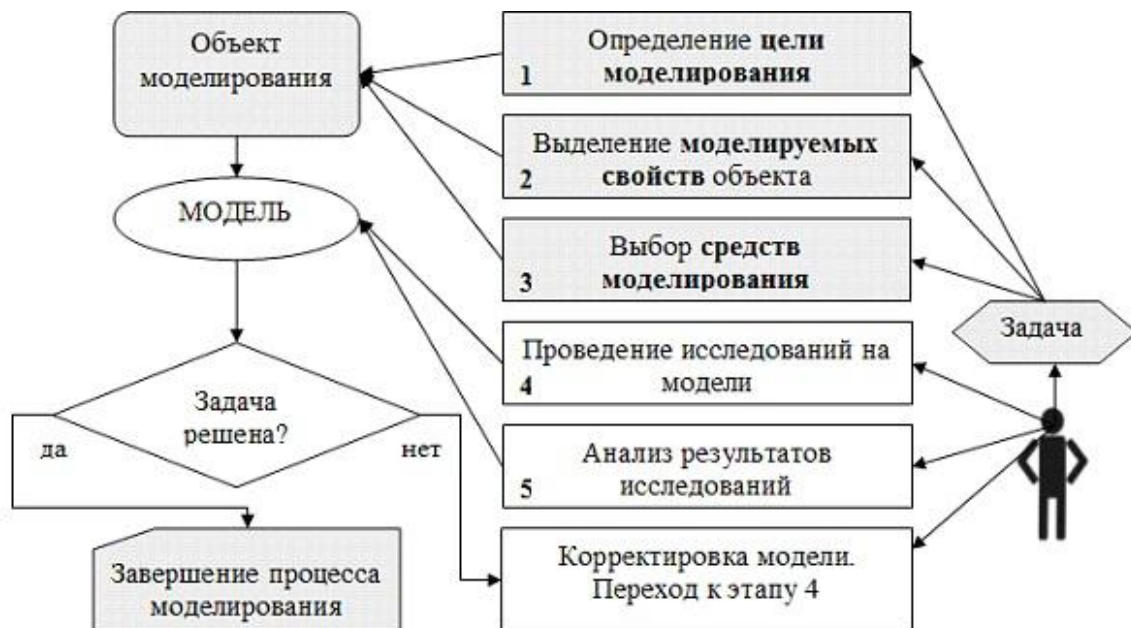
Рис. 1.2. Схема процедуры решения задачи посредством моделирования

Процесс решения задачи средствами моделирования отображает схема, показанная на рис. 1.2. Под реальным объектом подразумевается исследуемый объект (система, явление, процесс). Модель – это материальный или воображаемый объект, который в процессе познания замещает реальный объект, сохраняя при этом его существенные свойства. Моделирование – это процесс исследования реального объекта с помощью модели. Исходный объект называется при этом прототипом или оригиналом .