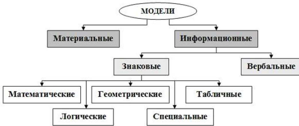
Рис. 1.4. Классификация моделей по способу представления

Геометрическая модель – модель, представленная с помощью графических форм (граф, блок-схема алгоритма решения задачи, диаграмма).